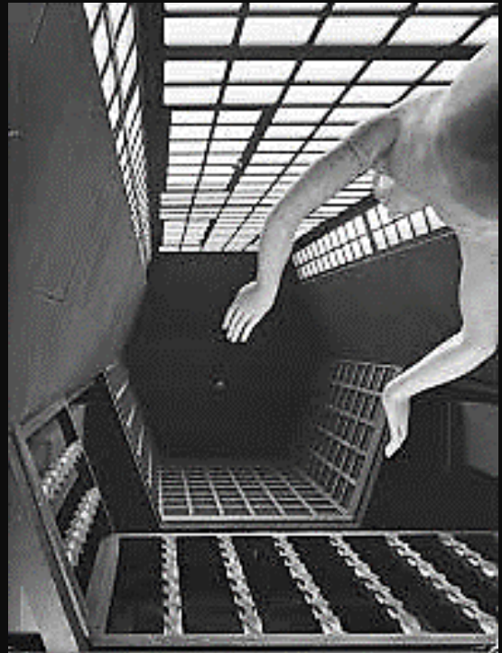
Charles Rennie Mackintosh, Mackintosh Library.