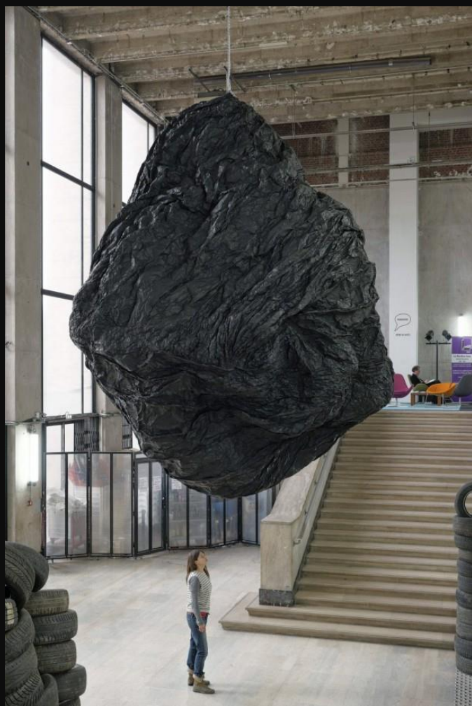
Palais de Tokyo, París, Eduardo Basualdo.